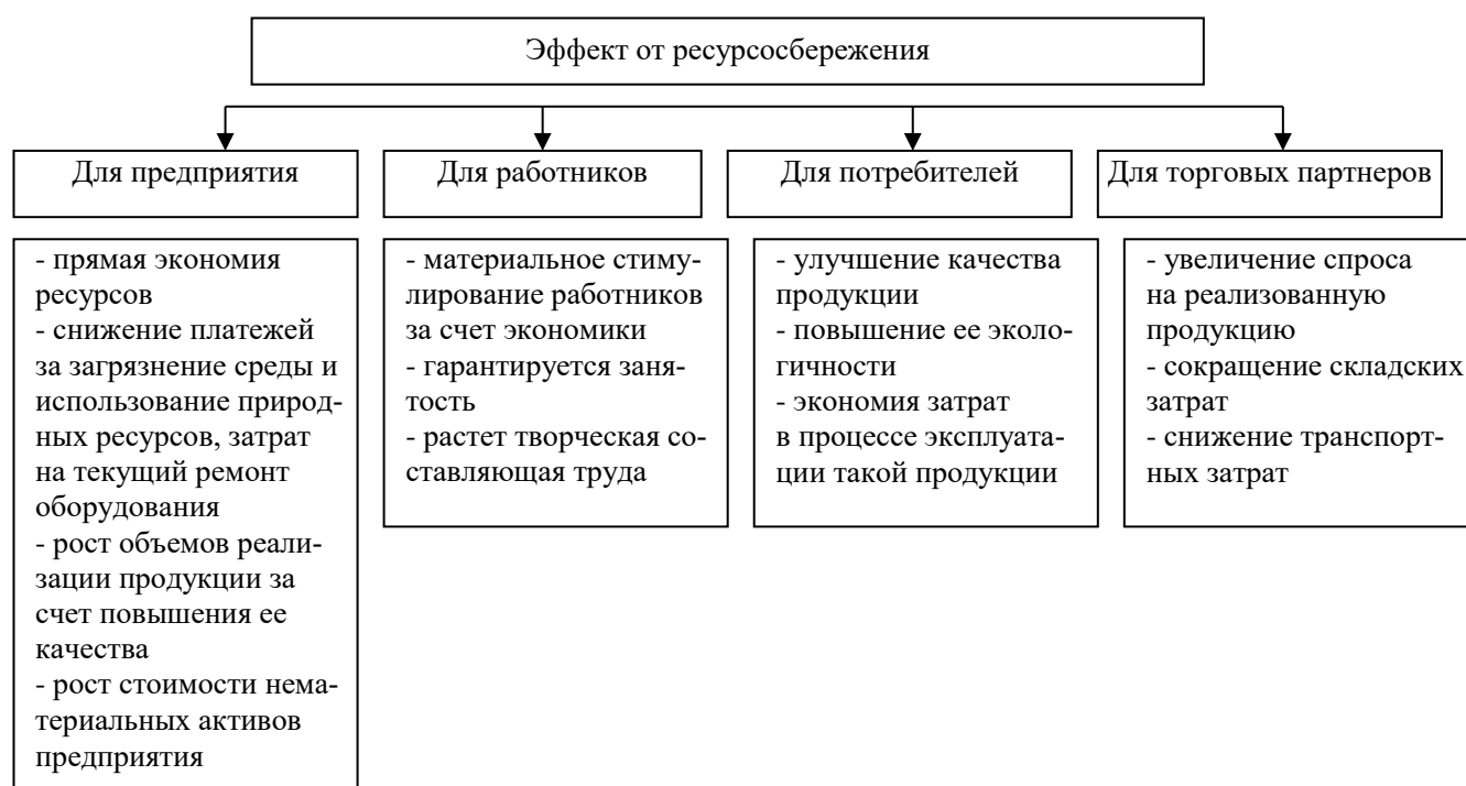
Рис. 5. Влияние ресурсосбережения на различных участников производственной деятельности промышленных предприятий (составлено авторами)