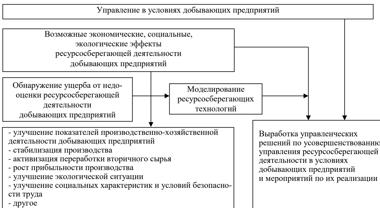
Рис. 3. Этапы формирования механизма управления ресурсосбережением на добывающих предприятиях (составлено авторами)

Этап формирования механизма управления ресурсосбережением на добывающих предприятиях изображен на рис. 3.