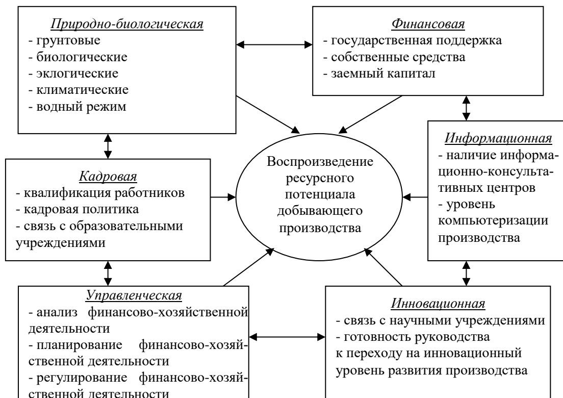
Рис. 2. Составляющие элементы воздействия на состояние ресурсосбережения добывающих предприятий (составлено авторами)