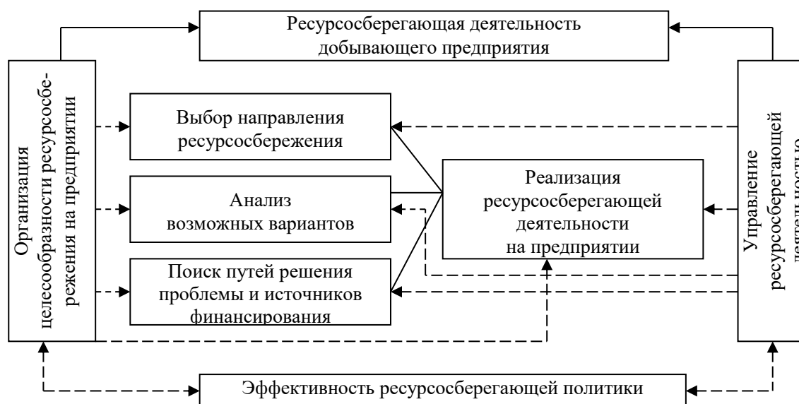
Рис. 1. Организационно-экономическая сущность процесса ресурсосбережения на промышленном предприятии добывающей отрасли промышленности (составлено авторами)

Ведущим в данном процессе являются два момента. Во-первых, ресурсосберегающая политика, как система управления, представляет собой процесс формирования и реализации управленческих решений (рис. 1).