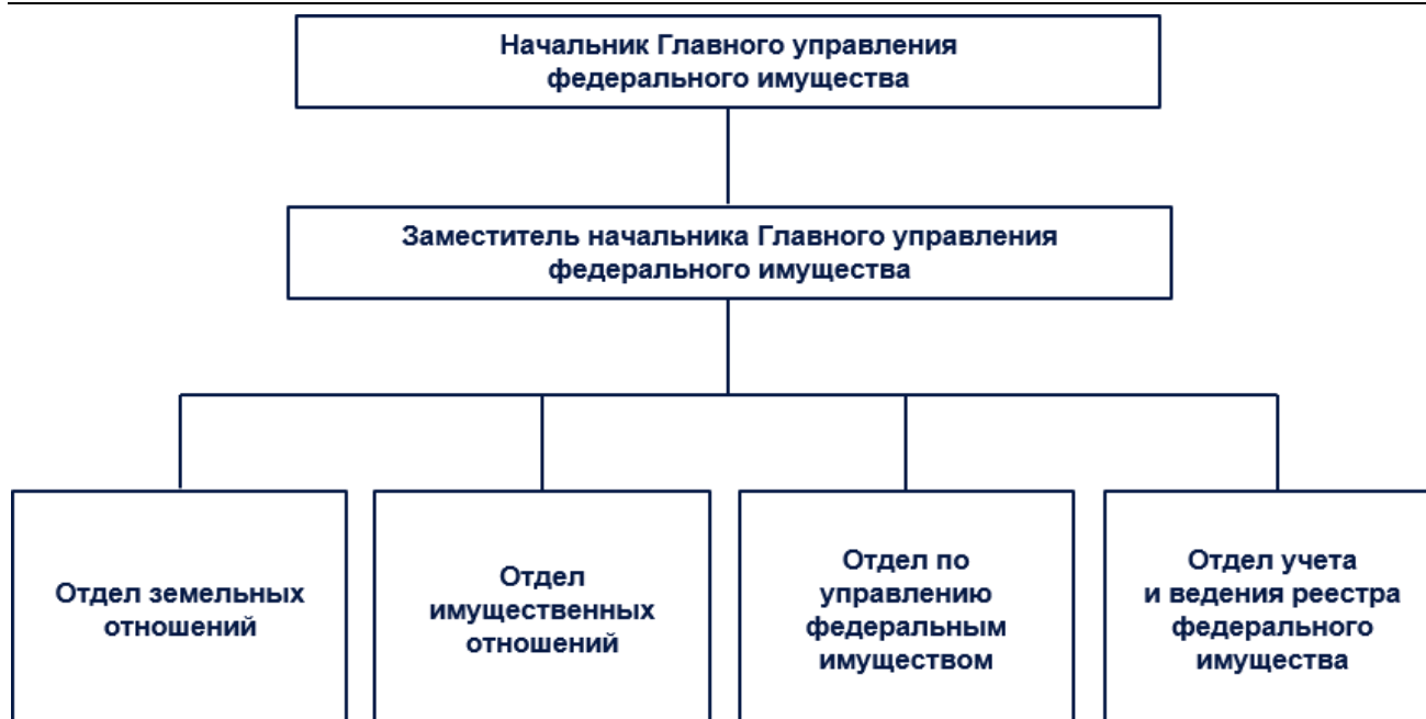
Рис. 2. Главное управление федерального имущества 1